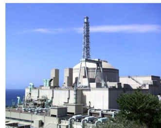
原子力機構 HP から